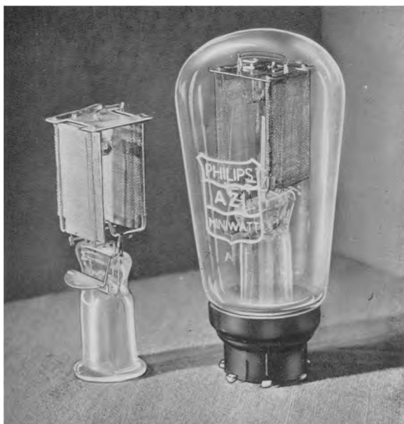
AZ1, die Gleichrichterröhre der neuen 4-Volt-Wechselstromserie.

Die Röhre AZ 1 ist eine direkt geheizte Vollweggleichrichterröhre, die bei verschiedenen Anodenspannungen und Belastungen verwendet werden kann. Die zulässige Anodenleistung ist so gross, dass ein normaler Empfänger bequem dadurch gespeist werden kann, auch wenn die Erregerwicklung eines fremderregten Lautsprechers den Gleichrichter mitbelastet. Dieser Gleichrichter ist mit dem neuen Seitenkontaktsockel ausgestattet.